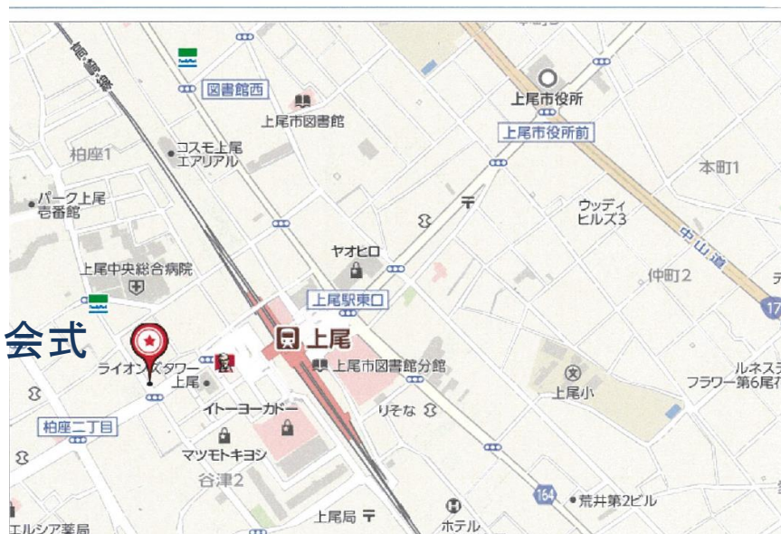
埼玉県上尾市谷津2丁目1周辺の地図