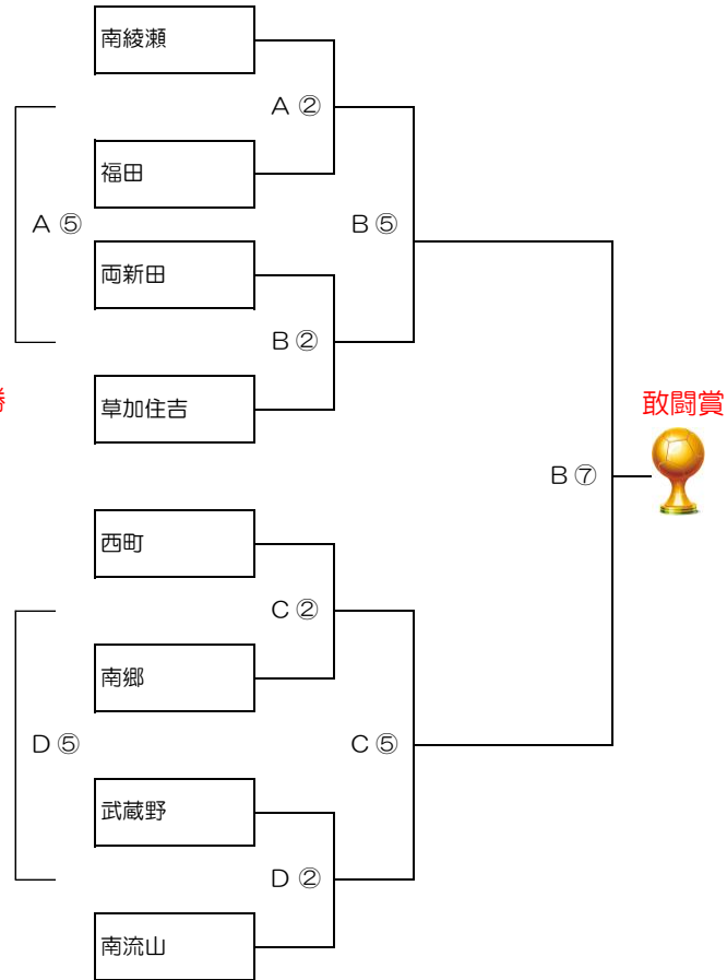
敢闘賞トーナメント