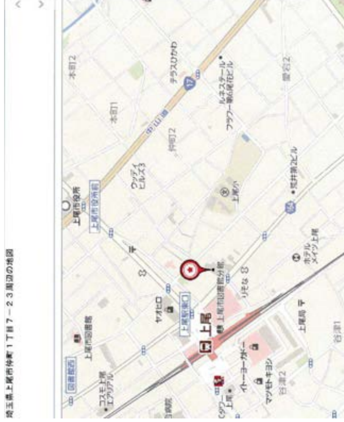
埼玉県上尾市仲町1丁目7-23周辺の地図